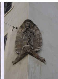
Statues du chat et la madone