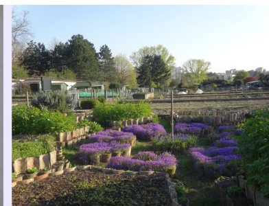
Les jardins ouvriers