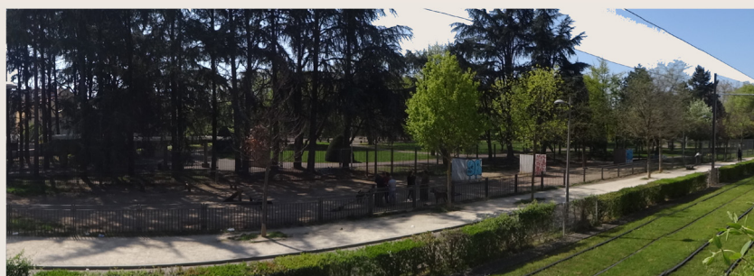
Le parc Bazin