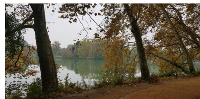
Étang du Parc de la Tête d'Or

5 Tourner à droite, impasse des Marronniers, et remonter l'impasse pour entrer dans le bois de Sermenaz. Dans une épinge à droite, continuer tout droit par le sentier. Au croisement, prendre à droite. Le sentier sort du bois et débouche sur un chemin plus large. Tourner à gauche. Passer la barrière et rejoindre l'arrêt de bus Rillieux Semailles. 6