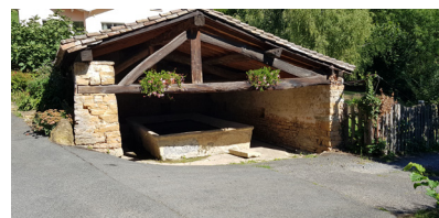
Lavoir de la Roche