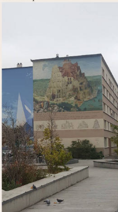
Quartier des Etats-Unis, Lyon

faire connaître l'oeuvre de l'architecte. Avec le plus bel ensemble de peintures murales de Lyon, son appartement musée des années 1930 et son espace d'accueil et d'exposition, ce musée en plein air, insolite et monumental permet de (re)découvrir cet architecte lyonnais emblématique.