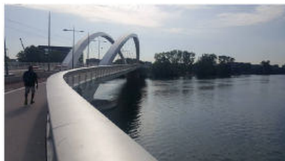
Pont "modes doux" R. Barre