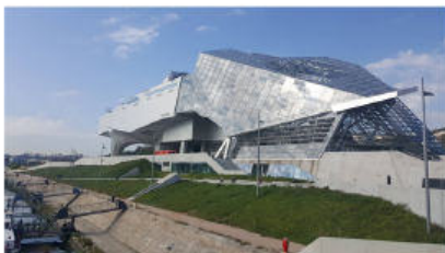
Musée des Confluences