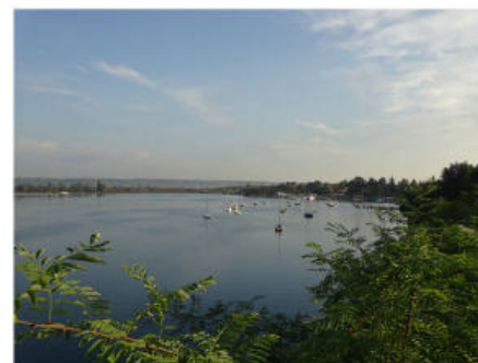
Baie du Grand Large