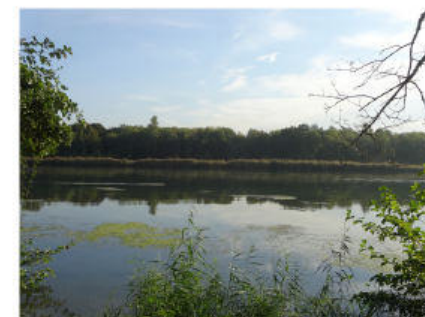
Canal du Grand Large