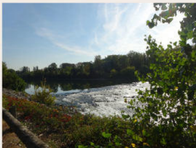
Vue sur le Rhône depuis le chemin de halage

Aujourd'hui, les chemins de halage sont réaménagés pour les piétons et cyclistes avec la création de voies vertes comme le projet de ViaRhona, reliant Genève (Suisse) à Port-Saint-Louis-du-Rhône (13).