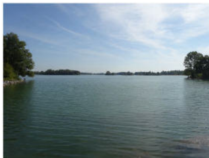
Etang du parc de Miribel Jonage