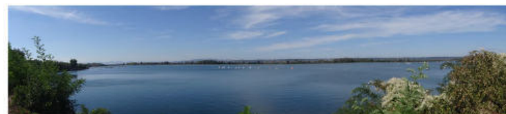
Bateaux sur le Grand Large

7 Au parking tourner à gauche, passer au-dessus de la rocade Est et continuer jusqu'aux voies du tram T3, arrêt "Décines Grand Large". 8