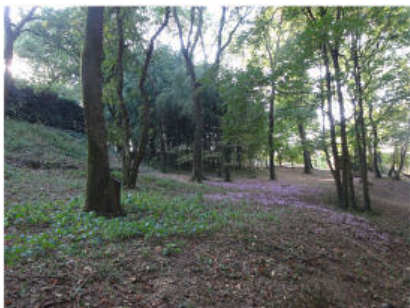
Cyclamen dans les sous-bois du Sermenaz