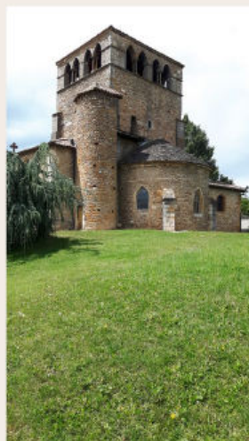
L'église de Montanay

visibles, les 4 autres étant cachés par les fenêtres. Ce sont les plus remarquables de la région lyonnaise avec celles de l'église de St Maurice de Gourdans. On peut aussi admirer plusieurs statues en bois doré en bon état.