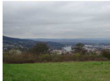
Vues sur les Monts d'Or et sur le val de Saône