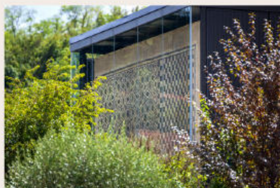
Mosaïque Cisiriana - Sérézin-du-Rhône (69)