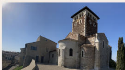
Eglise Saint-Mayol - Ternay (69)

en construisant cette maison des champs (Château de La Porte).