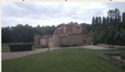
Le château du Sou

Il a appartenu à plusieurs familles au cours des siècles puis a été vendu comme bien national à la Révolution. Il a maintenant plusieurs propriétaires. On en visite les extérieurs seulement mais on peut également louer les intérieurs pour des banquets de mariage.