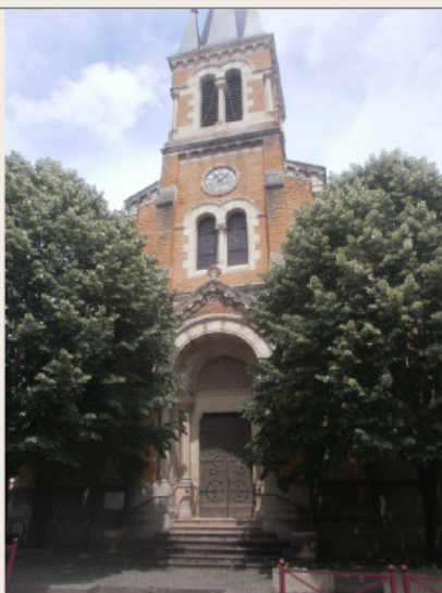
L'église de Rivolet

Petit village du Rhône qui relie le Val de Saône à la vallée d'Azergues, il serait né en 1533 lors de la fondation de sa chapelle. D'abord rattaché à la commune de Cogny, Rivolet en devient indépendant en 1792. Aujourd'hui, Rivolet se démarque grâce à son église construite entre 1865 et 1867 avec deux types de pierres : la pierre dorée de Cogny et la pierre blanche de Pommiers. La carrière de Rivolet, quant à elle, est exploitée pour la construction des routes pour son sable et son gravier.